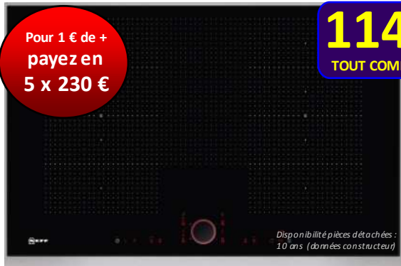
Table induction NEFF T68 TS 61 N0

Modularité totale ! 2 zones FlexInduction XL pour placer les casseroles, marmites et sauteuses où vous le souhaitez. La table ne chauffe qu'à cet endroit. PowerMove+ : la zone FlexInduction est divisée en 3 parties (forte chaleur devant, chaleur moyenne au milieu et maintien au chaud au fond). TwistPad Fire est un bouton amovible, magnétique et illuminé qui permet de régler aisément toutes les zones de cuisson. Puissance du foyer principal : 3700 W. HxLxP : 5,1x82,6x54,6. + d'infos sur www.neff-home.fr